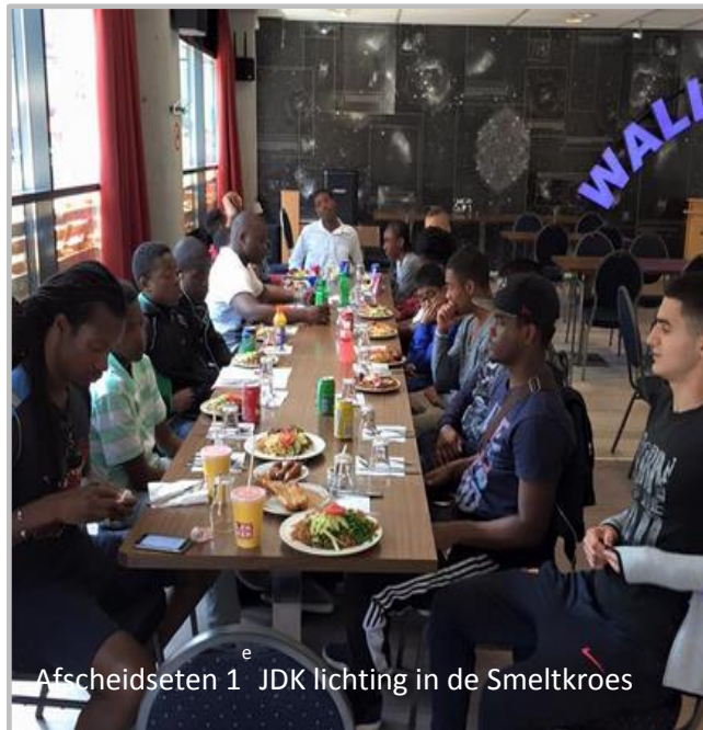
Afscheidseten 1 JDK lichting in de Smeltkroes