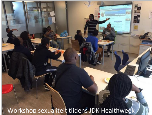
Workshop seksualiteit tijdens JDK Healthweek

Na het lezen van dit jaarverslag zult u begrijpen: een JDK schooljaar biedt vele enerverende momenten. Omdat beelden vaak meer zeggen dan 1000 woorden, hier een kort beeldoverzicht van JDK schooljaar 2014-2015.