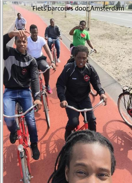
Fiets parcours door Amsterdam