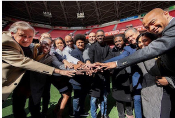
Maatschappelijk initiatief "Zuidoost Werkt".

Stichting JDK wil daarom grote dank uitspreken aan alle bedrijven die JDK Support mogelijk maakt. De zeventien jongeren zijn enorm trots om binnen deze bedrijven een plek gevonden te hebben. Stichting JDK hoopt in de toekomst nog meer jongeren te kunnen plaatsen op de arbeidsmarkt.